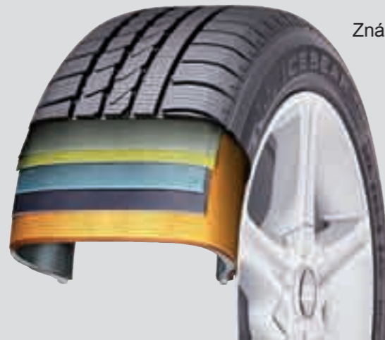
Znázornění Runflat systému pneumatiky ICEBEAR W300R

Maximální bezpečnost pro všechny řidiče: Hankook vyvinul samonosnou pneumatiku ICEBEAR W300 s dojezdovou technologií „Runflat-System“. To znamená, že v budoucnu při technické poruše a také při kompletní ztrátě tlaku můžete pohodlně a zcela klidně pokračovat k nejbližšímu servisu. Technologie Vám zaručuje bezpečný dojezd do vzdálenosti 80 km s maximální rychlostí až 80 km/h. Jak je něco takového technicky možné? Díky intenzivní práci výzkumného týmu vysoce kvalifikovaných odborníků, s použitím speciálních materiálů a výrobních technik bylo dosaženo velmi vysoké stability bočnic pneumatiky. Vyztužené boční hrany výrazně zlepšují jízdní vlastnosti HRS pneumatik. Mimoto je také dosaženo zlepšení bočního vedení a přesnosti řízení. A ještě jedna dobrá zpráva nakonec: Hankook Runflat-System pneumatiky mohou být namontovány na standardní ráfky.