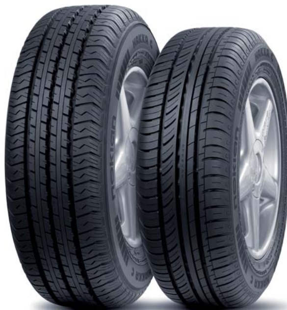
Hakka C Cargo